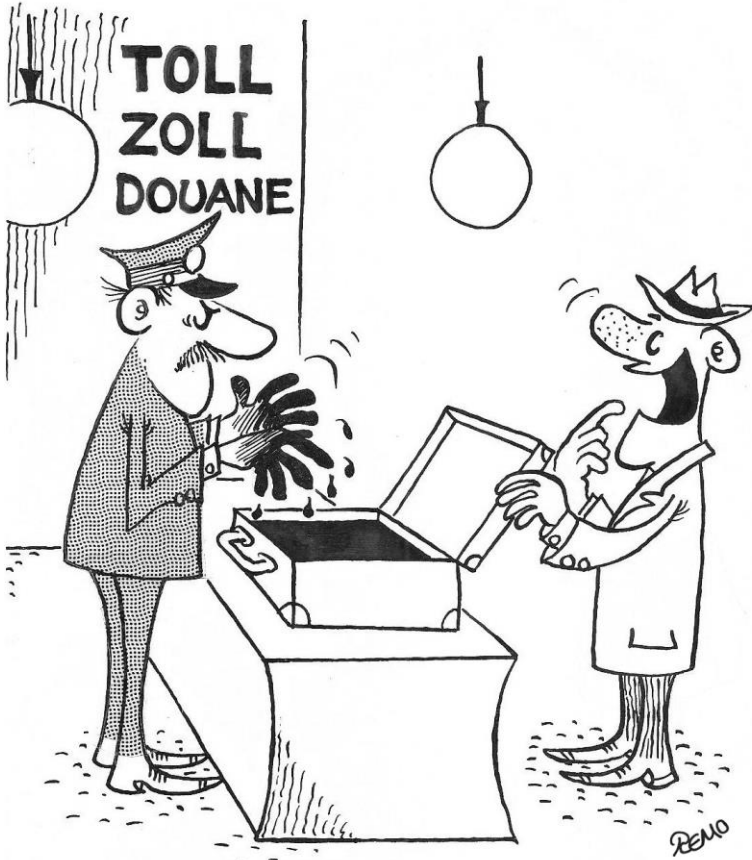
Det er vel ikke forbudt, at indføre tjære!